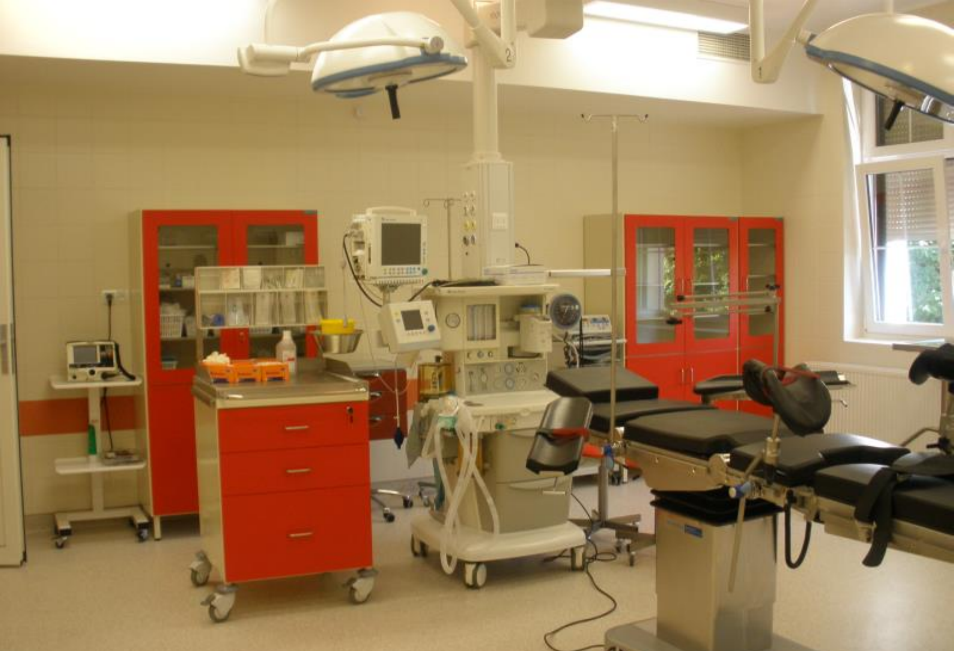
Sala operacyjna w Oddziale Patologii Cięży