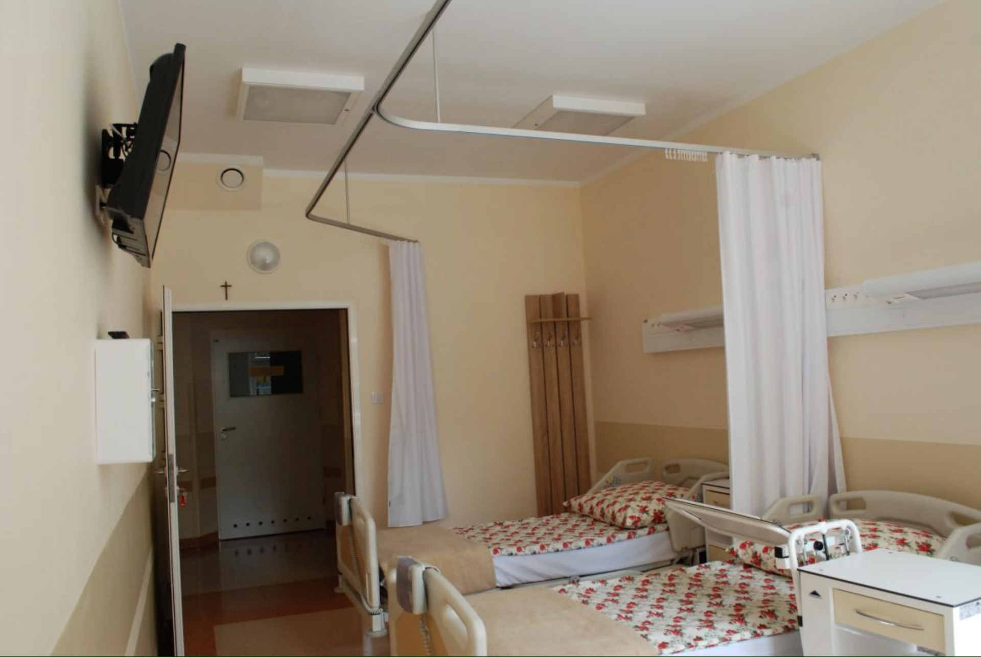
Sala chorych Oddziału Ginekologii