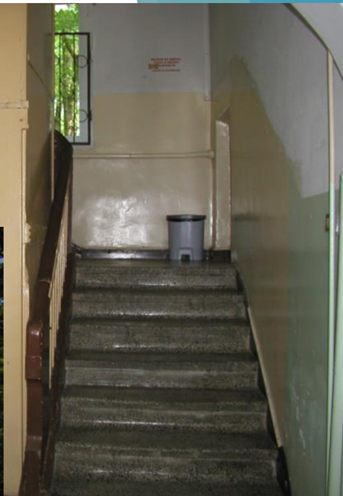
Oddział Wewnętrzny B – przed remontem