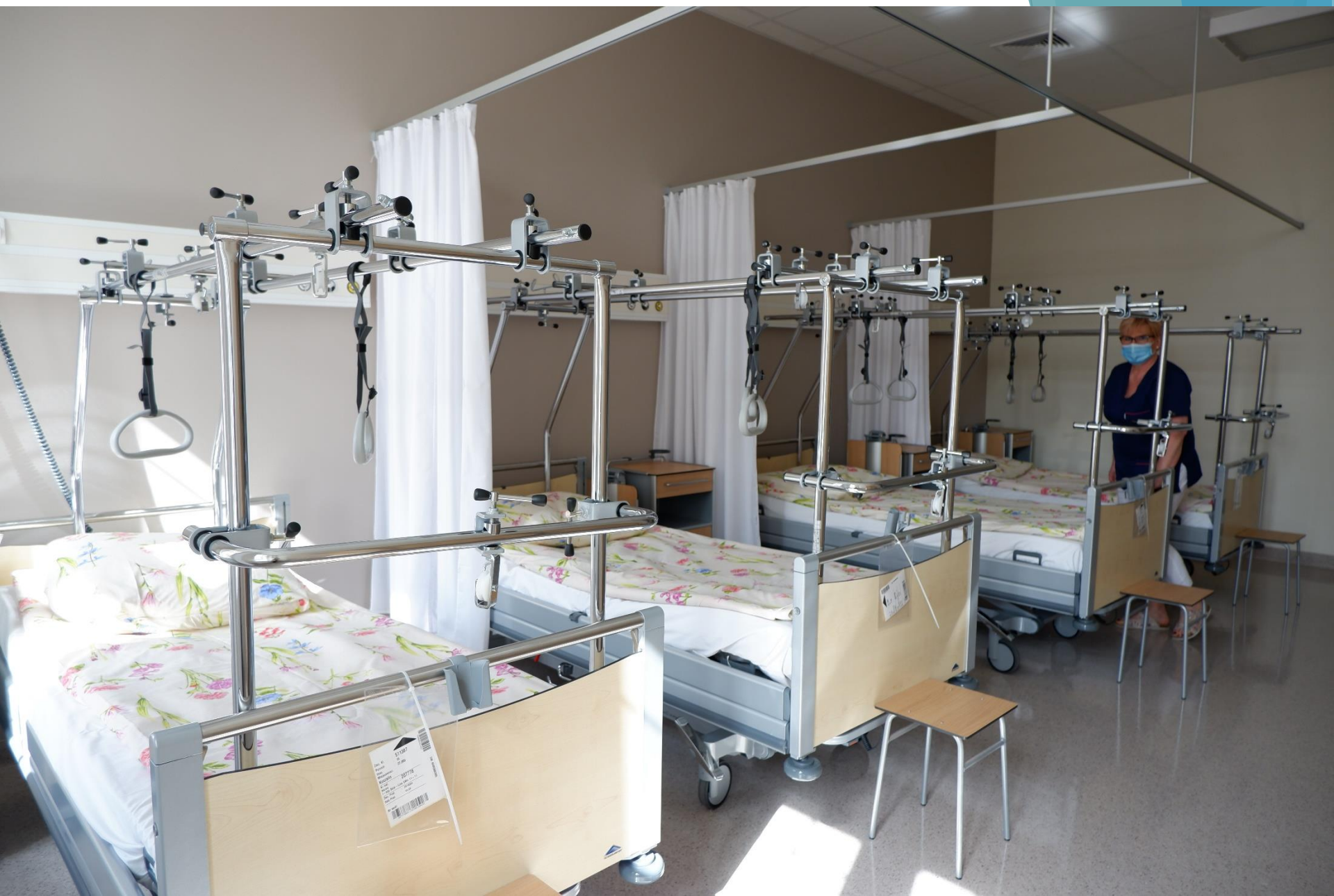
Oddział Chirurgii Urazowej i Ortopedycznej