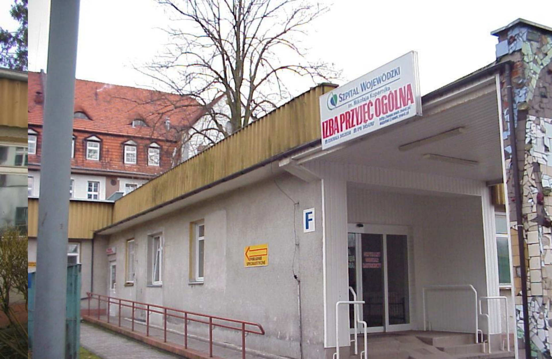
Szpitalny Oddział Ratunkowy – przed remontem