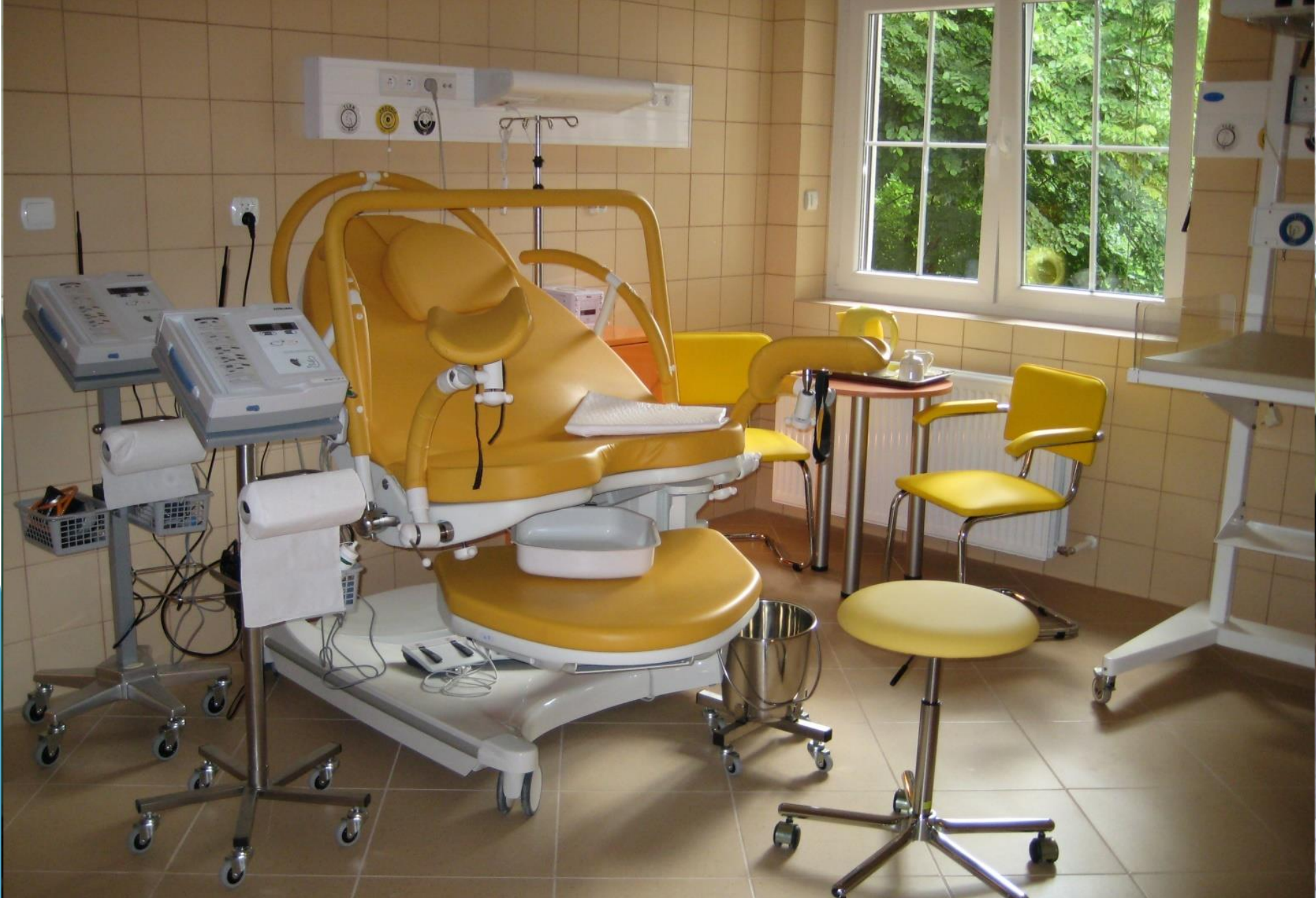
Sala porodowa – przed remontem