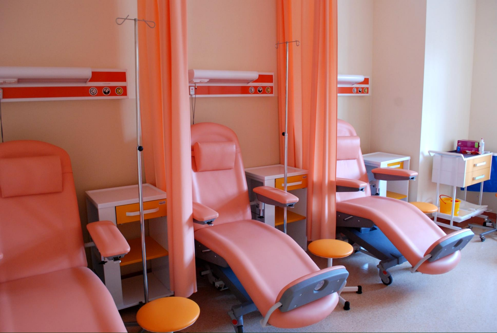
Sala chorych Oddziału Dziennego Chemioterapii